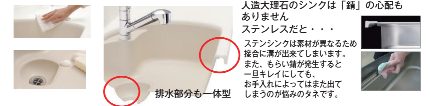
排水部分も一体型

人造大理石のシンクは「錆」の心配もありません。ステンレスだと・・・ ステンシンクは素材が異なるため接合に溝が出来てしまいます。また、もらい錆が発生すると一旦キレイにしても、お手入れによってはまた出てしまうのが悩みのタネです。